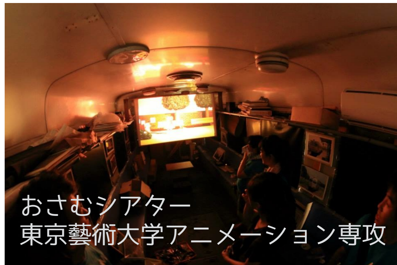
おさむシアター 東京藝術大学アニメーション専攻